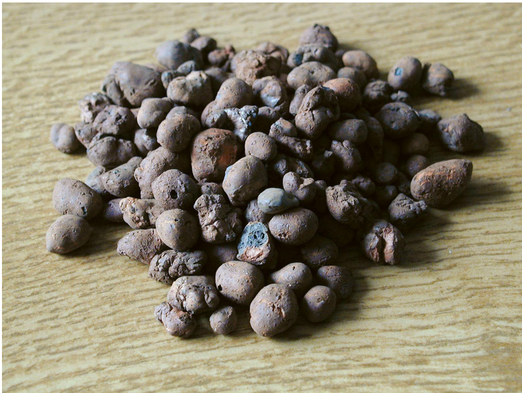
Der (Grund-) Stoff, aus dem die (Haus-) Träume sind: Blähtonperlen